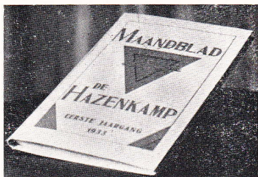
Twaalf nrs. in bandje, ingebonden f 1.—, DRUKKERIJ DEKKER - GROENESTR. 311.

L. G. JAUTZE, Groesbeekscheweg 255 Tel. 2920